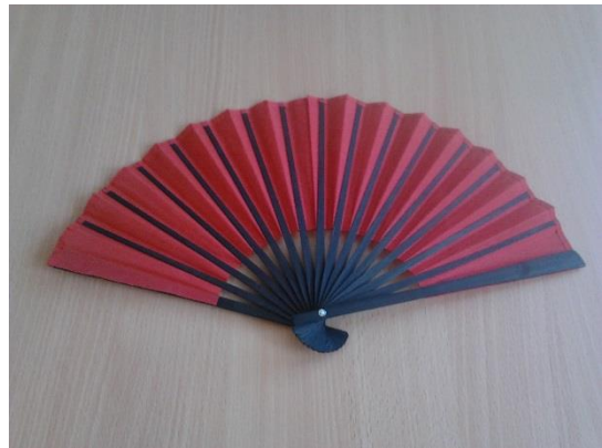
Vifte: Leonora Christine