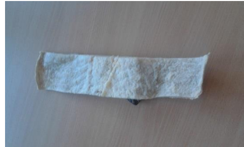
Tørret og saltet fisk: Bonden