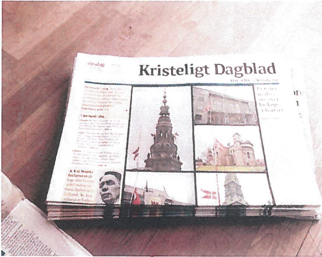
Avisartikler omkring terror