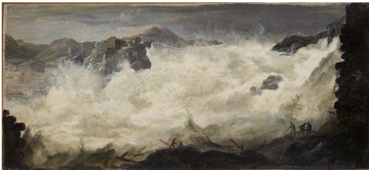
Erik Pauelsen: Sarpfossen , 1788