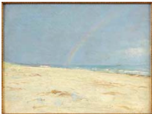
P.S. Krøyer: Strand ved Skagen med regnbue , 1895