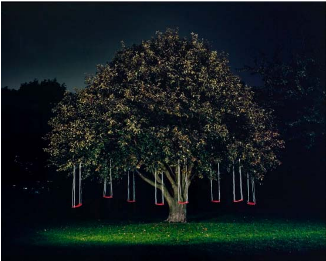
Astrid Kruse Jensen: Constructing a Memory , 2006