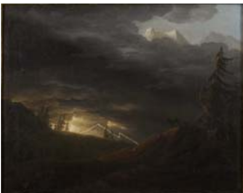
Jens Juel: Tordenvej i Alperne , 177-79