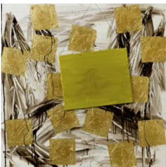
Peter Bonde: Landskab med monokrom (3) , 1986

Eleverne placerer sig selv i billedet. Diskutér, hvordan man kan vise, hvordan det er at opholde sig i de to naturscener, alt efter hvilken størrelse og placering eleven vælger, han/hun selv skal have på tegningen.