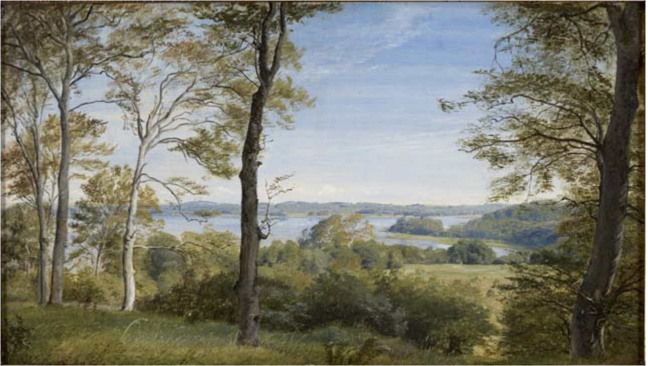
P.C. Skovgaard: Udsigt over Skarritsø , 1844